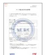
ADEC 発行のデータ適正消去実行証明書

データ適正消去実行証明協議会 (ADEC) の「データ適正消去実行証明書」を発行できます。ADEC 証明書発行が可能なので、PC の廃棄時のデータ消去にも使用できます。